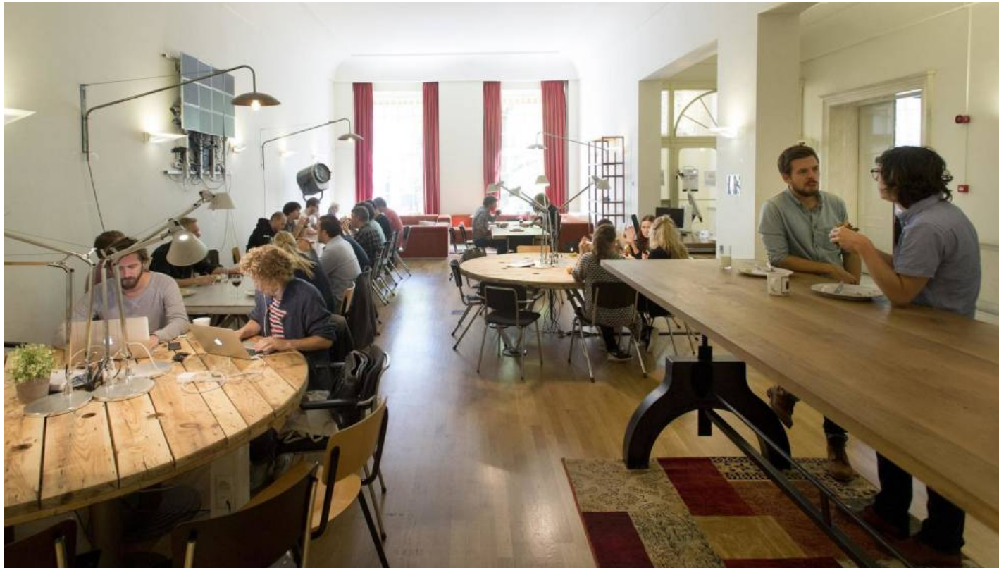
Interior de una incubadora de 'startups'.