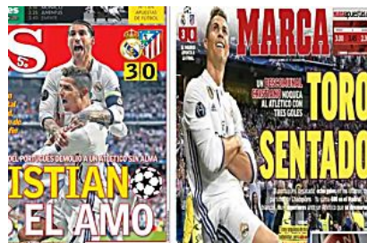
"Cristiano Ronaldo es el amo" Sport