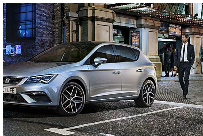
Nuevo SEAT León. Muy equipado por 14.990€ SEAT.es