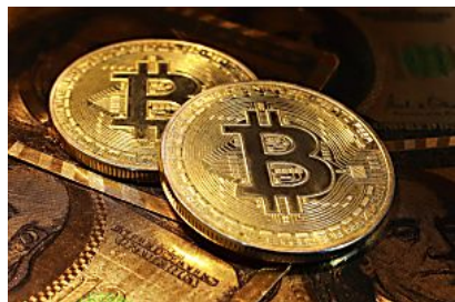
¿Recuerda cuando el Bitcoin estaba a 50 $? eToro Blog ES