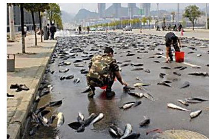
La lluvia de peces existe. ¡Si no te lo crees mira! El Tiempo