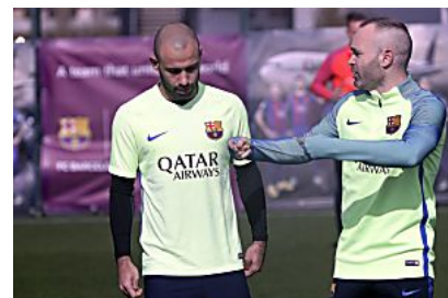
Iñiesta apura su recuperación para jugar ante el Villarreal Sport