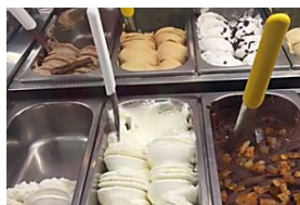
Gelato wars El Periódico