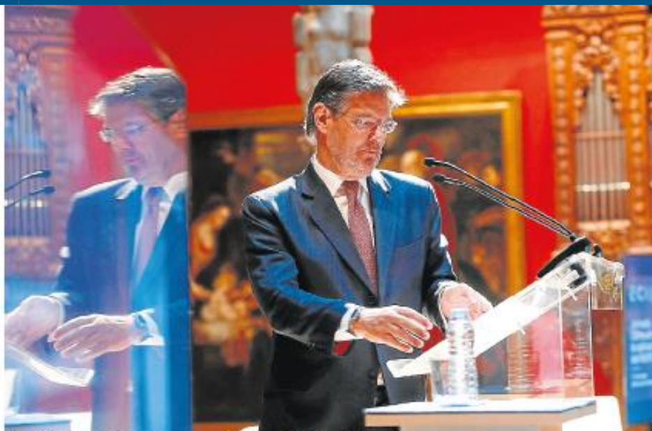
El ministro Rafael Catalá, ayer en el Patio de la Infanta de Ibercaja. TONIGALÁN